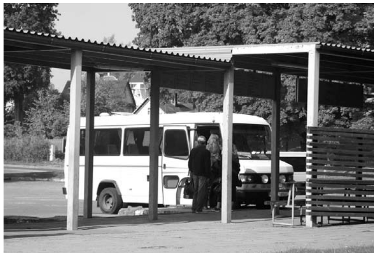
Autobusų maršrutų karantino metu sumažėjo, tačiau kai kuriais jų dabar gyventojai vežami nemokamai.