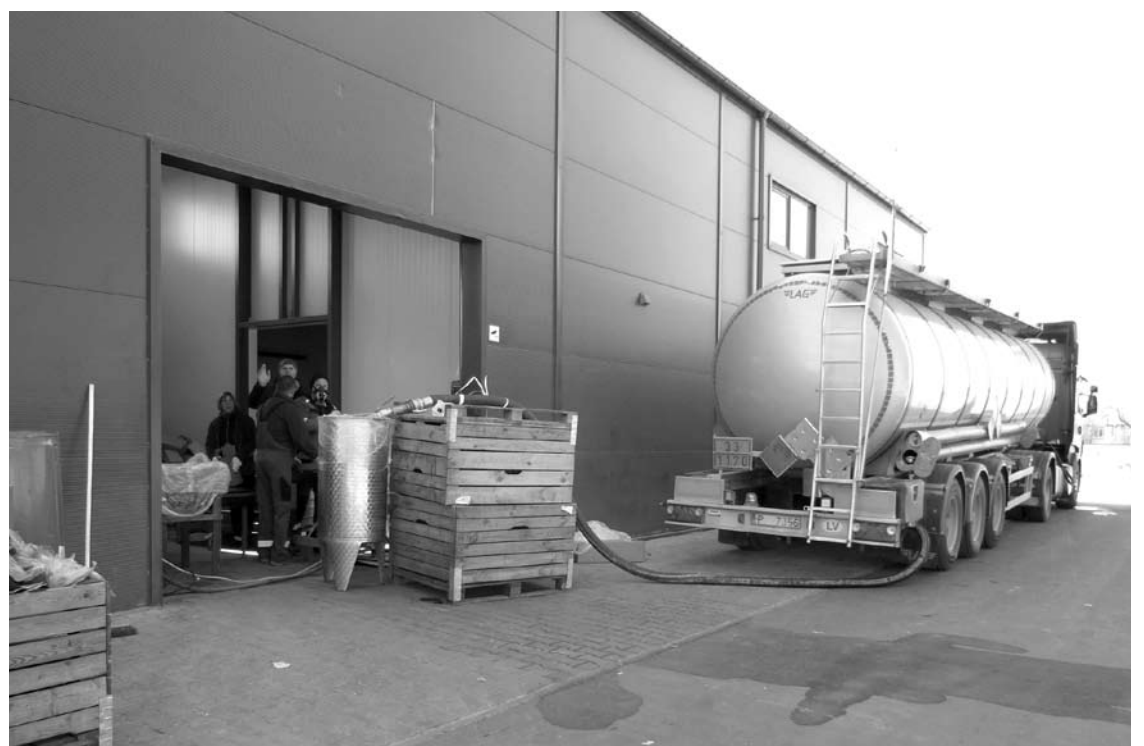
Ažuožeriuose iš autocisternų dezinfekcinis skystis pilstomas į penkialitrus pakus.