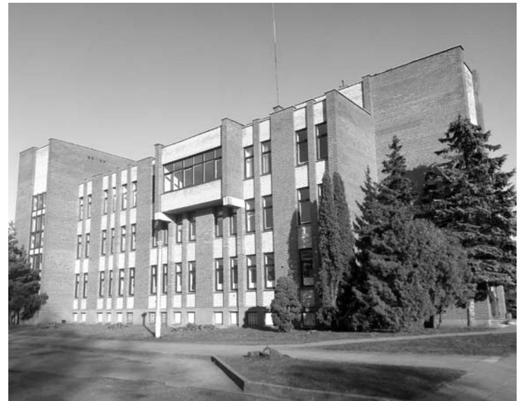
Anykščių pirminės sveikatos priežiūros centre per karantiną pacientams yra įvesta nauja griežta tvarka.

„Žvelgiant į statistiką, galima remtis dažniausiu pavyzdžiu apie gripą. Skaičiuokime, kiek žmonių miršta nuo gripo ir kiek nuo koronaviruso - nėra