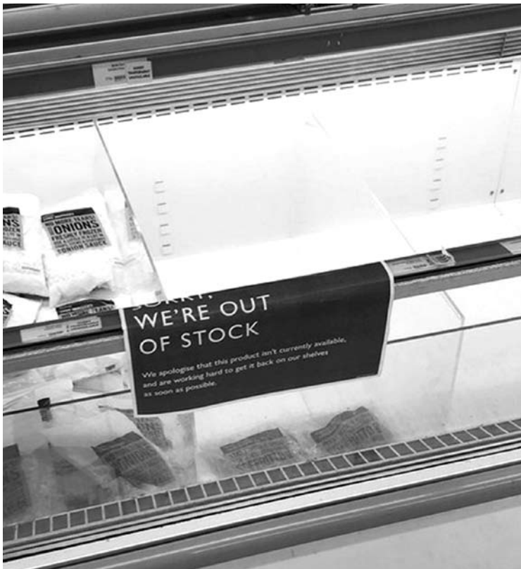
Parduotuvėse kabėjo užrašai įspėjantys, kad baigėsi produktų atsargos.